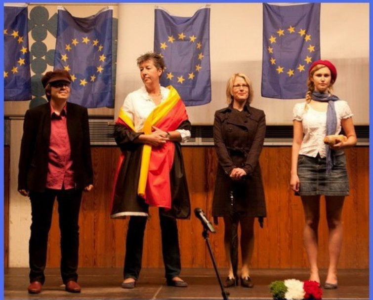
Mit einem Tucholsky-Zitat von 1932 begann die Show.

Die Schule feierte ein buntes Fest mit einer EUROPA-RALLYE für die Unter- und Mittelstufe und einem höchst abwechslungsreichen Programm in der Aula: Polit-Talk, Sketche, Tanz, Kabarett und viel Musik.