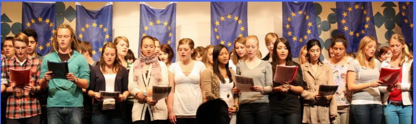
Der Oberstufenchor sang "Freude, schöner Götterfunken" und Hymnen der EU-Mitgliedsländer.