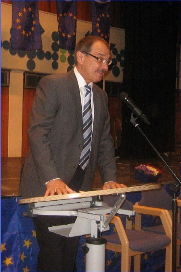
Der Schulleiter begrüßt die Gäste.

Die Schule feierte ein buntes Fest mit einer EUROPA-RALLYE für die Unter- und Mittelstufe und einem höchst abwechslungsreichen Programm in der Aula: Polit-Talk, Sketche, Tanz, Kabarett und viel Musik.