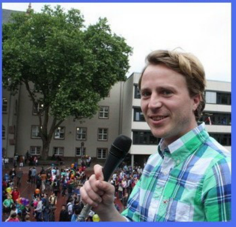
Pünktlich um 13.45 Uhr ließen die LfG-Schüler mehr als 400 bunte Luftballons in den Duisburger Luftraum aufsteigen.